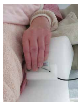
コミュニケーション支援 (スイッチ操作)