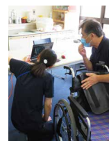
オンライン専門相談 (車椅子シーティング)