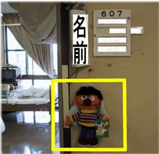
病室が分かるように名前を大きくし、目印として人形をつくる

環境調整や代償訓練などの方法はいろいろありますが、病院ではこんな試みを行っています。